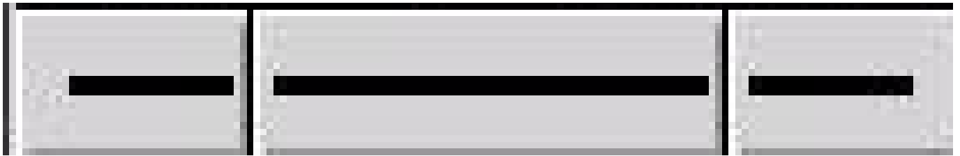
Figure 4.3: Marraren propietateak

Marrak erraz edita daitezke geziak eta horrelako elementuak sortzeko. Tresna-koadroaren behealdean 3 botoi daude marrekin. Klik egin eta sakatuta edukita, menu bat azalduko da aldaketaren emaitza ikusteko.